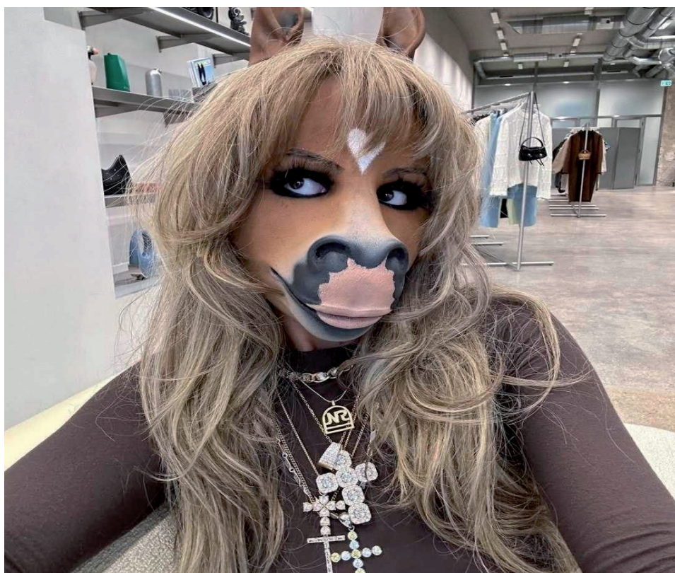
Рис. 1. Немецкая певица и диджей С. Сталлион

Звезда охотно рассказывает легенду о своем «животном» происхождении. HorsegirlL, мол, недавно отдыхала в Эквадоре, где паслась на сочных пастбищах. Также ее выходы в прямой эфир сопровождаются звуками, характерными для этих непарнокопытных [21].